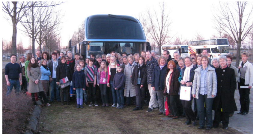
Die „Sternschnuppen-Reisegruppe“ aus Hannover nach einem ereignisreichen Tag auf der Leipziger Buchmesse 2011!

Es war ein wirklich sehr schöner Tagesausflug mit Ihnen. Ich freue mich sehr darauf, Sie wieder zu sehen. Und besonders gern erfüllen wir natürlich Ihre zahlreichen Bücherwünsche.