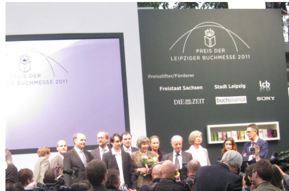
Die Preisträger mit Jurymitgliedern 17. März 2011

Samstag, der 19. März 2011 , wird mir in sehr guter Erinnerung bleiben.