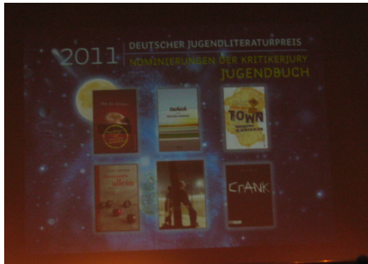
Bekanntgabe des Jugendliteraturpreises 17. März 2011

Weitere Highlights neben Autorinnenbegegnungen waren das Miterleben der Bekanntgabe der Nominierungen des Jugendliteraturpreises und die Teilnahme an der Preisverleihung des Leipziger Buchpreises.